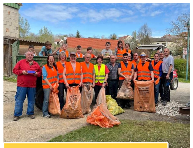
Flurreinigung Maigen | Foto: Zeitelberger