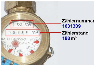
Zählernummer 1631309 Zählerstand 188m³

Alle Jahre wieder sind Gemeinden gefordert, durch eine möglichst flächendeckende Wasserzählerablesung die Grundlagen für eine korrekte Wasserendabrechnung zu schaffen.