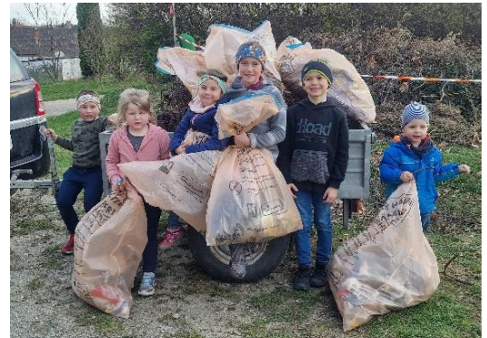
Die Kinder von Stockern halfen fleißig beim Müllsammeln. Ein ganzer Anhänger wurde gefüllt.