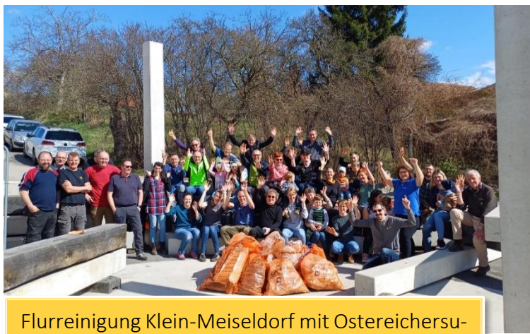
Flurreinigung Klein-Meiseldorf mit Ostereichersuche für die Kleinen